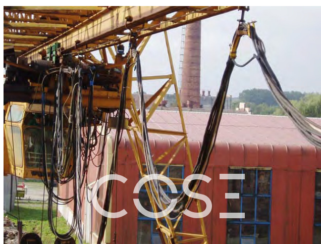
Fig. / Мал. 1